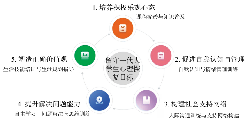
图1 留守一代大学生心理恢复目标定位与内容规划

(5) 培养积极的生活态度和价值观。引导学生树立积极的生活态度和正确的价值观，增强对生活的热爱和对未来的希望。