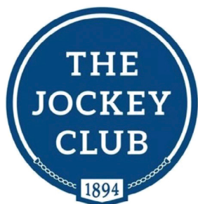
图1 美国赛马会的标识

技术服务于行业内的特定细分市场,从药物、马福利到运动的善后和营销,赛马会为各行业带来了盈利。