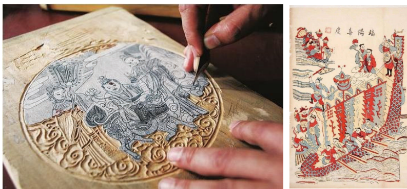
图 2 苏州桃花坞年画雕刻图及成品图

清代插画：西方石版画印刷技术传入中国，极快取代了刻版印刷的形式，插画开始从黑白变得彩色多样。就艺术风格而言，结合民情风俗的民间套色木版年画在清代风行一时，色彩造型单纯明快，色彩绚丽，展示着独特的民间艺术风韵。