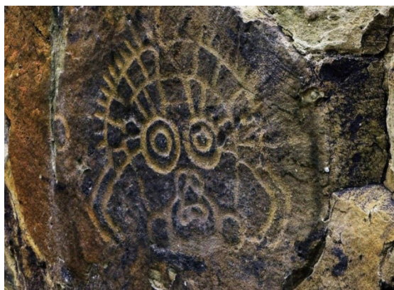
图1 贺兰山岩画所雕凿的人脸图案

贺兰山岩画，绘制于春秋战国到西夏时期。多以形形色色的类人首为题材，多采用涂饰手法。在贺兰山白芨沟等地，还发现了成片彩绘岩画，内容以乘骑征战人物形象及北山羊、马等动物形象为主。